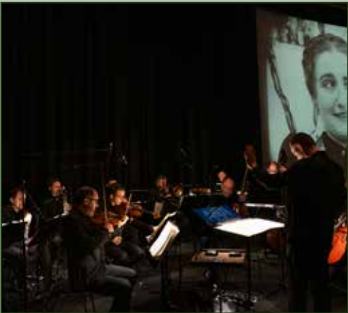
(1) Handeln, bevor es zu spät ist: Analoges Filmmaterial in Zersetzung; (2) Vor der Digitalisierung: Materialien sichten, bewerten und reinigen; (3) Digitale Bearbeitung: Die ursprüngliche Ästhetik des Films erhalten und originale Farben und Helligkeiten genau wiederherstellen; (4) Endlich wieder auf der Kinoleinwand: Stummfilm mit Live-Musik vor großem Publikum