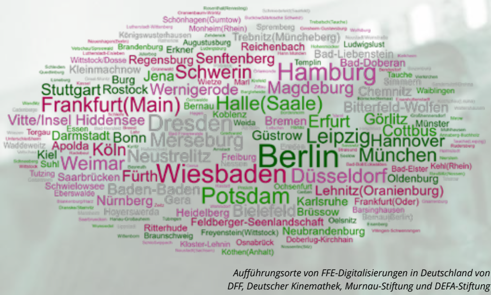
Aufführungsorte von FFE-Digitalisierungen in Deutschland von DFF, Deutscher Kinemathek, Murnau-Stiftung und DEFA-Stiftung

In allen Bundesländern werden die digitalisierten Filme gezeigt: